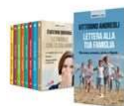
SORRIDI ALLA VITA