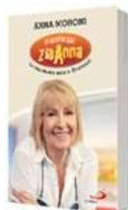
ANNA MORONI - IN CUCINA CON ZIA ANNA