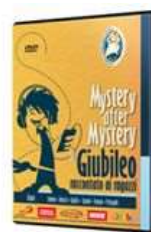
MYSTERY AFTER MYSTERY