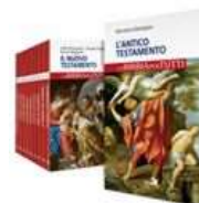
LA BIBBIA PER TUTTI