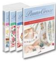
CREARE A PUNTO CROCE