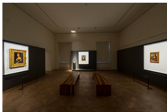
Reggia di Venaria Reale, Torino. Mostra "Raffaello. Il Sole delle Arti"