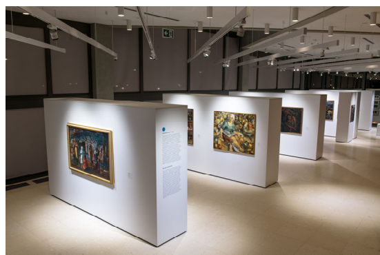
Museo di Arte Contemporanea Belgrado